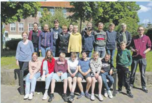
Gruppe St.-Willehadi 1