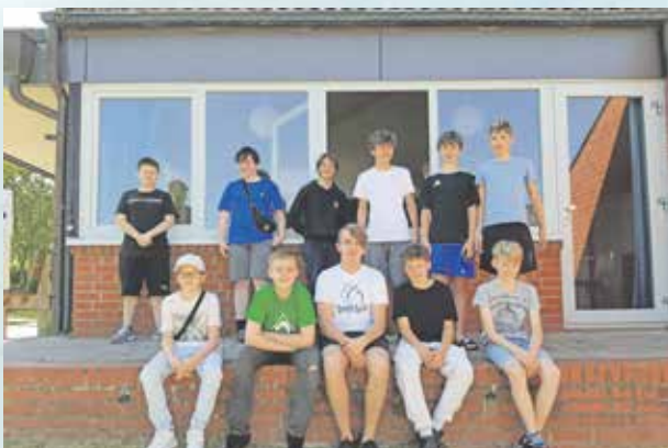
Gruppe St. Johannes 1