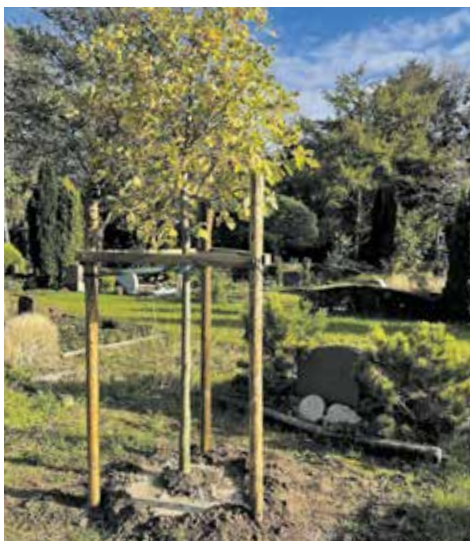
Die neue Eiche steht

2023 haben wir auf unserem Friedhof einiges neu gepflanzt und angelegt. So wurden zwei Bäume (eine Eiche und ein Amberbaum) gepflanzt, etliche abgelaufene Gräber geräumt und Rasen eingesät und angefangen breitere Wege anzulegen. Für den Frühling und Herbst 2024 ist eine bienen- und insektenfreundliche Buschreihe geplant und die Fläche beim ehemaligen Denkmal wurde neu hergerichtet und Lavendel auf der Anhöhe gepflanzt