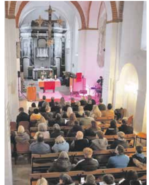
In der Klosterkirche St. Marien

Nach dem Gottesdienst gab es noch einen Empfang mit Kaffee und Kuchen, Softdrinks und Laugengebäck. Dort wurde sich lebendig unterhalten und ich habe mich gefreut alle Leute zu sehen, die extra aus nah und fern gekommen sind: Kolleg*innen, Konfirmand*innen, Teamer*innen, Familie, Freunde usw. aus Bremerhaven, Hannover, Kiel... Damit meine Freunde dann nicht nur für 2 Stunden angereist sind, haben wir danach noch bei mir zuhause auf meine Einsegnung angestoßen und Tacos gegessen - das war