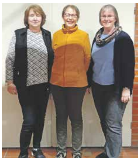
Der Vorstand vom Förderkreis

Die Vorsitzende berichtet über die Aktivitäten und die Projekte, die der Förderkreis unterstützt hat. Zudem wird der Kassenbericht vorgestellt. Alle Vereinsmitglieder und andere Interessierte sind dazu herzlich eingeladen.