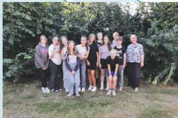
Gruppe St. Johannes 2