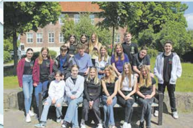
Gruppe St.-Willehadi 2