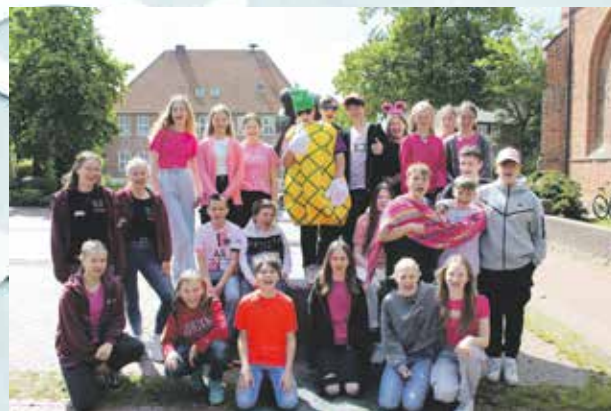
Gruppe St. Marien