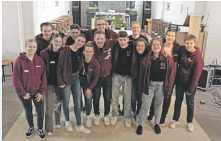
Teamer und Teamerinnen