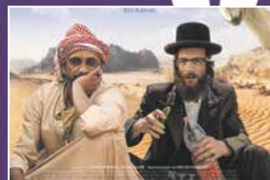
Kirchen und Kino