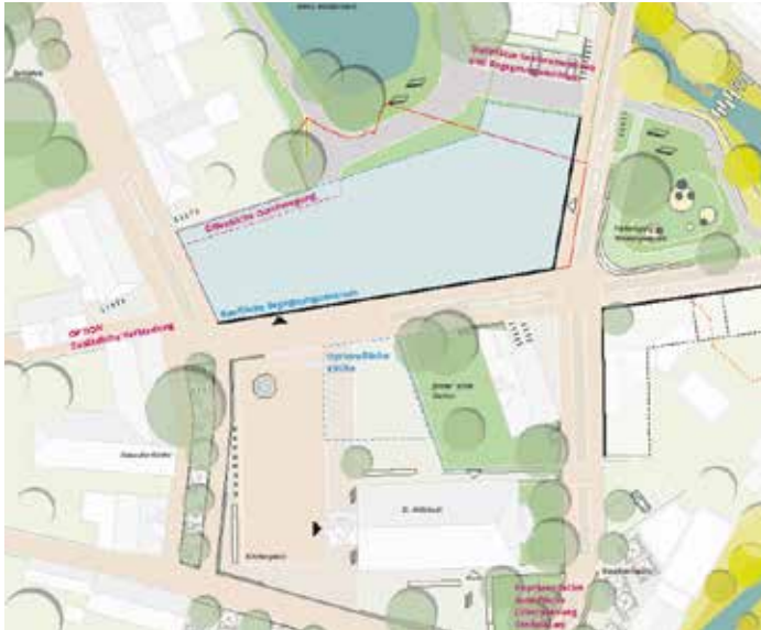
Der Plan vom Begegnungszentrum wird nicht realisiert

Eine Stellungnahme zum Aus des Begegnungszentrums von Jutta Rühlemann